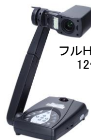
フルHD書画カメラ 12倍光学ズーム M70HD

テレビ会議システムに書画カメラを接続して、製品サンプルや印刷物、精密機器のパーツなどを拡大表示し相手側に表示させながらの会議ができます。また、書画カメラは、テレビ会議以外にモニターに直接接続して単体での利用もできます。